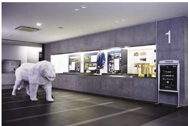
図1 「トラと家具？」展全景