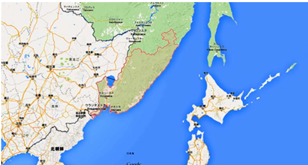
図10 ロシア沿海地方 (赤い枠線)