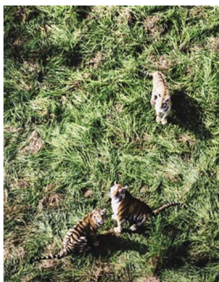
図5 ヘリコプターから捉えた野生のアムールトラの家族