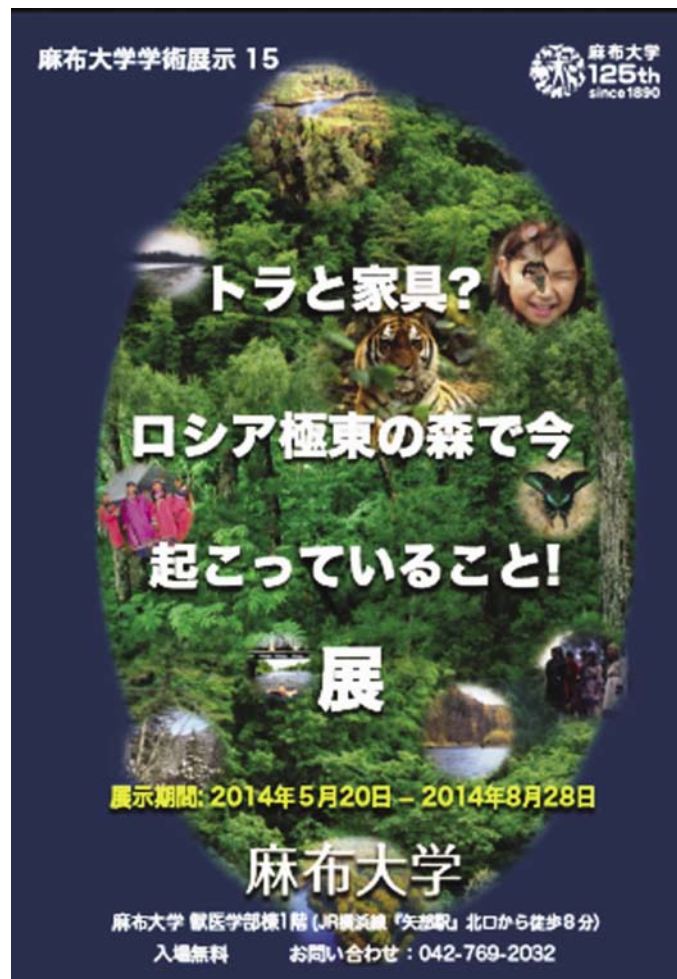
図11 第15回学術展示ポスター