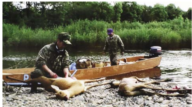
図7 仕留めたノロジカをさばく猟師の兄弟