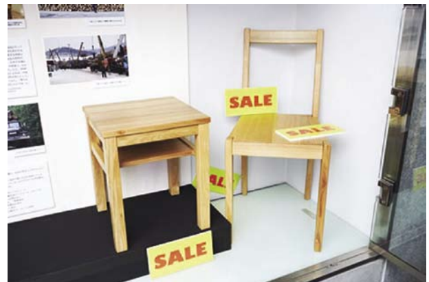
図9 タモを使用した中国製のイスとサイドテーブル