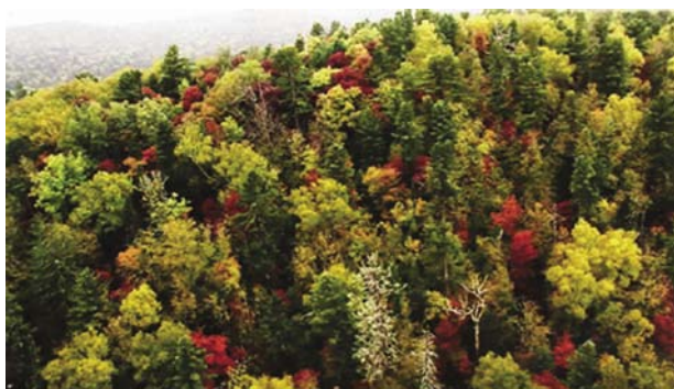
図3 広葉樹が色づく「黄金の秋」