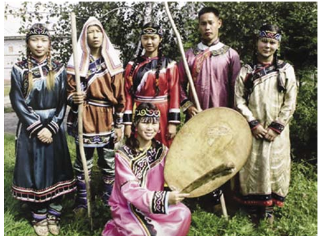
図6 お祭りで民族衣装を着ている村の若者たち