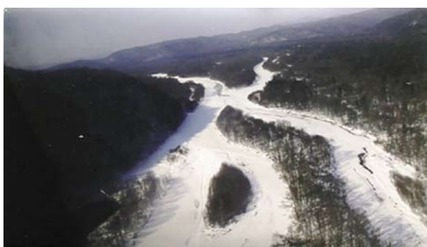
図4 冬の川は凍り付き動物と人の道路に変わる