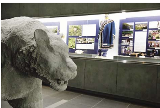
図2 トラの塑像と展示パネル